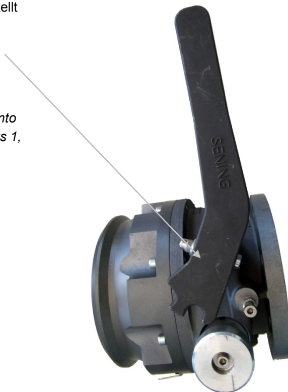
Abb. (fig.) 3: Montage 2 (assembly 2)